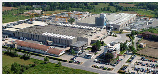
Impianto di prefabbricazione Magnetti Building