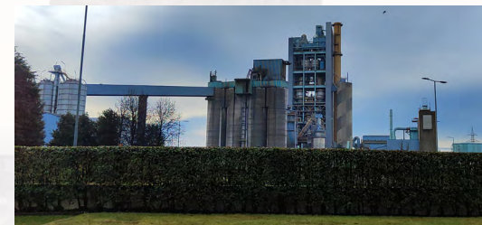
Cementeria Heidelberg Materials